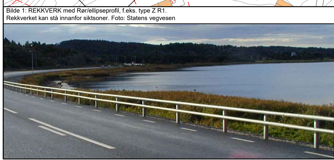
Bilde 1: REKKVERK med Røreliseprosfil, f.eks. type Z.R1. Rekkverket kan stå innanfor siktsoner.