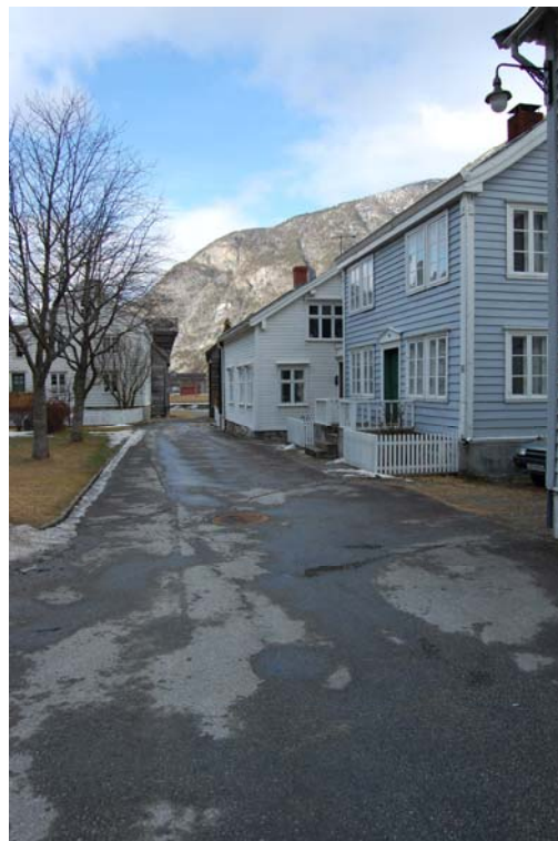
Bygningsmiljø langs Øyragata i verneområdet.